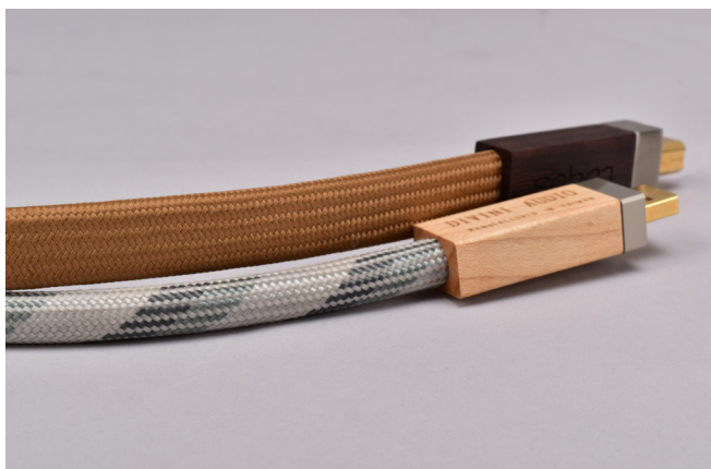
Logos與UM-12內部結構相似，都有雙層屏蔽構造。Logos為扁線設計，使導體間隔更寬裕，導體本身兩款線則有不同用料。